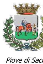
Piove di Sacco