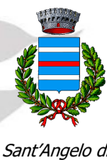
Sant'Angelo di P.