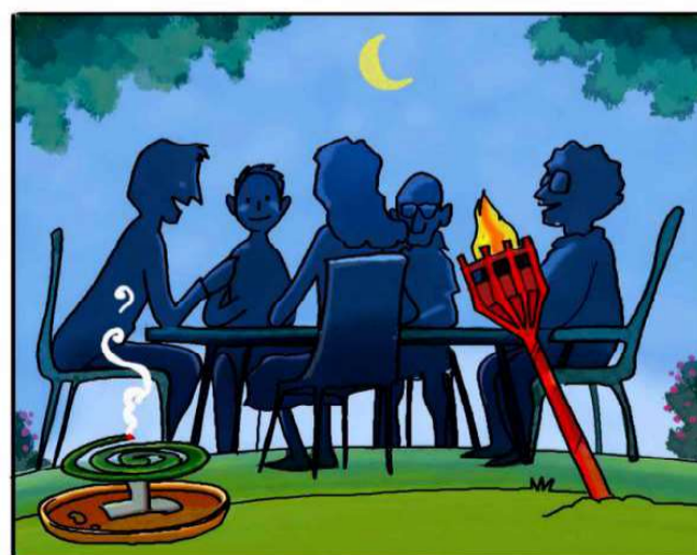
QUANDO SOGGIORNI ALL'APERTO, PROTEGGITI CON REPELLENTI AMBIENTALI. (*)

(*) Leggi attentamente le istruzioni riportate sulle confezioni.