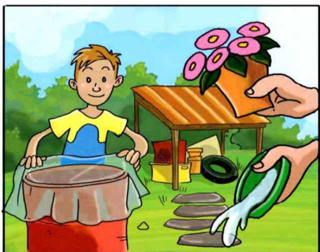
METTI AL RIPARO DALLA PIOGGIA TUTTO CIÒ CHE PUÒ RACCOLGERE ACQUA.

(*) Leggi attentamente le istruzioni riportate sulle confezioni.