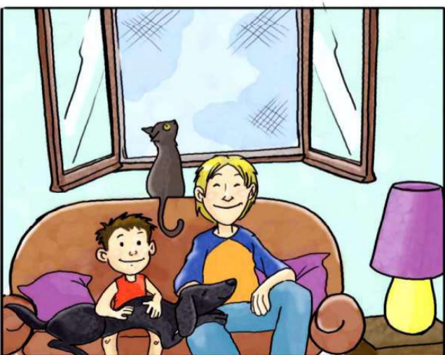
IN CASA USA LE ZANZARIERE ANZICHÉ ZAMPIRONI E FORNELLETTI.